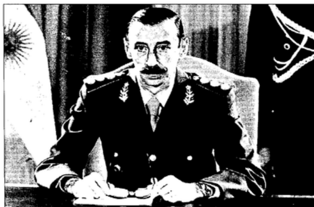
El general Videla encabezó el golpe de Estado en Argentina en 1976

La Audiencia investigará la desaparición de 38 españoles en Argentina